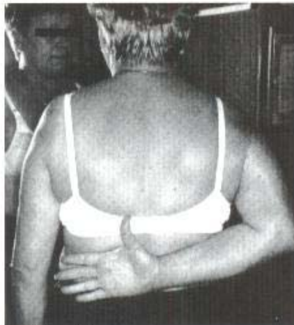
Fig. 1G - Abdução

de articular e força muscular próximas ao normal. Durante caminhada em passeio público sofreu nova queda ao solo, resultando em fratura espiralada longa, ao nível da ponta da cimentação. O deslocamento era mínimo e se optou por tratamento conservador com o uso de pinça de confeitiro inicialmente e órtese fabricada sob medida ( Orthoplast ® ) posteriormente. Aos três meses, ainda não havia qualquer sinal de consolidação óssea; além disso, o quadro de dor local era mais intenso, bem como a mobilidade no foco de fratura. Optou-se, então, pelo tratamento cirúrgico através de osteossíntese com placa de neutralização da AO, parafusos interfragmentários, cerclagem e enxertia óssea homóloga (do ília-co). A consolidação óssea ocorreu antes do 6 o mês de pós-operatório. Ao completar um ano de evolução, a mobilidade é ainda limitada (70° de elevação, 45° de rotação externa e T 10 de rotação interna) (fig. 1).