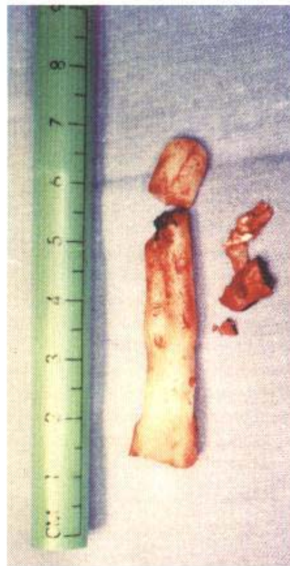
Fig. 1C - Ressecção de parte do cimento ósseo, que facilitará a fixação da fratura