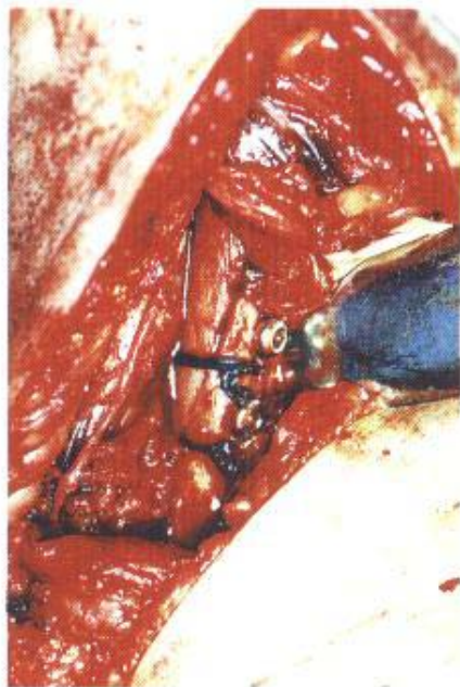
Fig. 1D - Aspecto transoperatório da fixação óssea com parafuso interfragmentar e amarração com Ethibond®