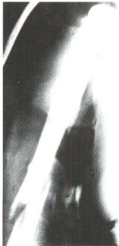
Fig. 1A - Fratura espiralada longa, localizada na extremidade distal da cimentação