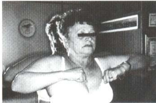
Fig. 1H - Rotação interna

Cofield, da Clínica Mayo, EUA, apresentou interessante revisão durante o Congresso da AAOS em fevereiro de 1997 (1) . Ele avaliou a frequência de complicações de artroplastias do ombro em 16 publicações entre 1982 e 1991; foram 1.046 casos operados e 126 complicações (total de 12%), divididos em: manguito rotador e problemas com a grande tuberosidade (37), ossificação heterotópica (27), instabilidade (19), afrouxamento da glenóide (17), fraturas (13), lesão nervosa (8), infecção (3), afrouxamento do componente umeral (3).