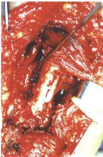
Fig. 1B - Aspecto transoperatório mostrando o cimento ósseo ao nível do foco de fratura