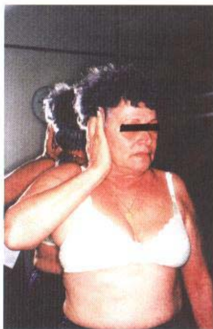
Fig. 1F - Elevação