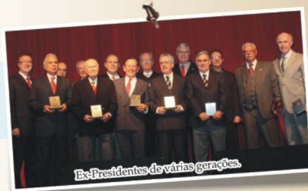
Ex-Presidentes de várias gerações.